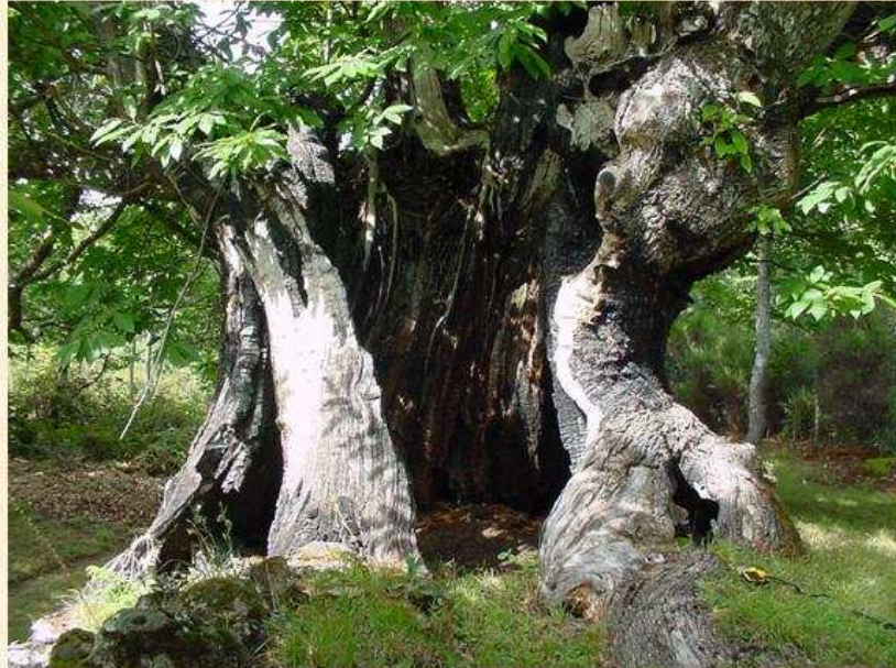
Castaño de Remesal Zamora