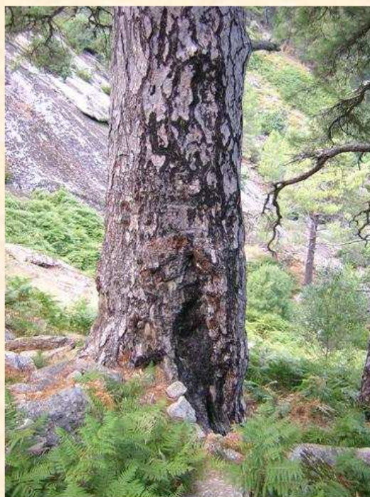
Pino Bartolo Ávila