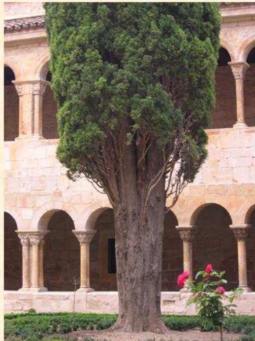
Ciprés de Silos Burgos