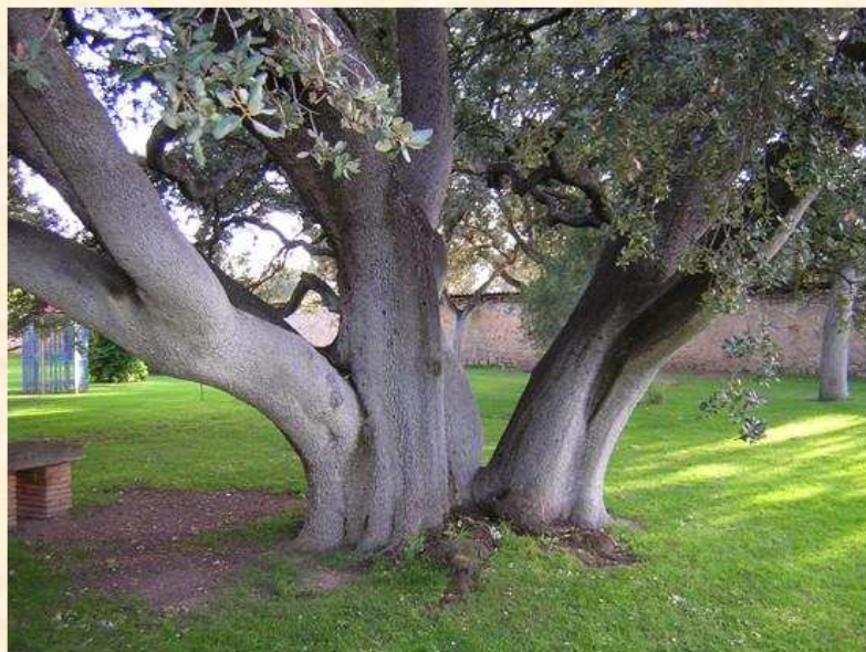
Encina de Quintanilla de Onésimo Valladolid