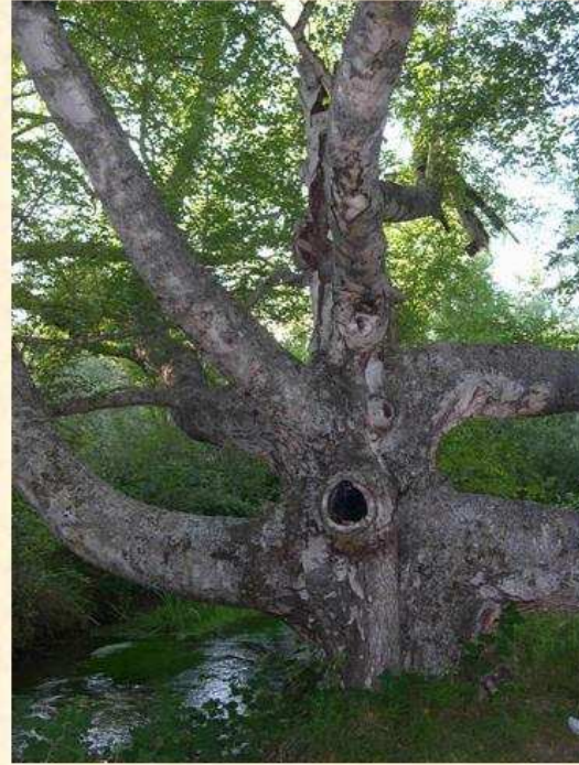
Abedul de Hinojosa de la Sierra Soria