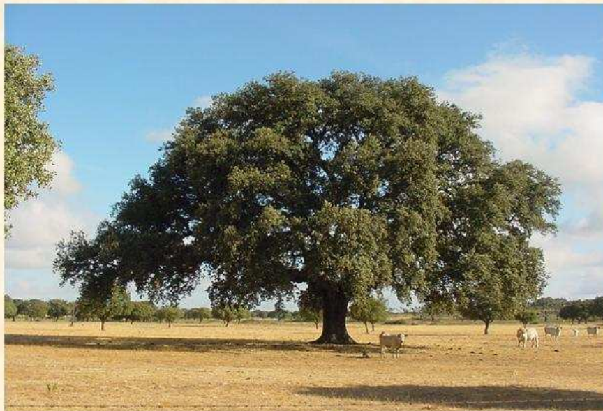
Encina del Águila Salamanca