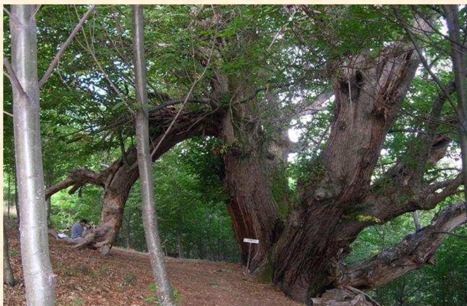
El Campano, Villafranca del Bierzo León