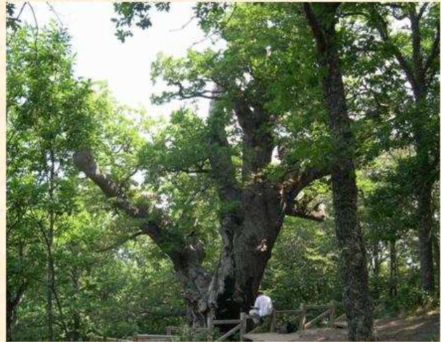
El Roblón de Estalaya Palencia